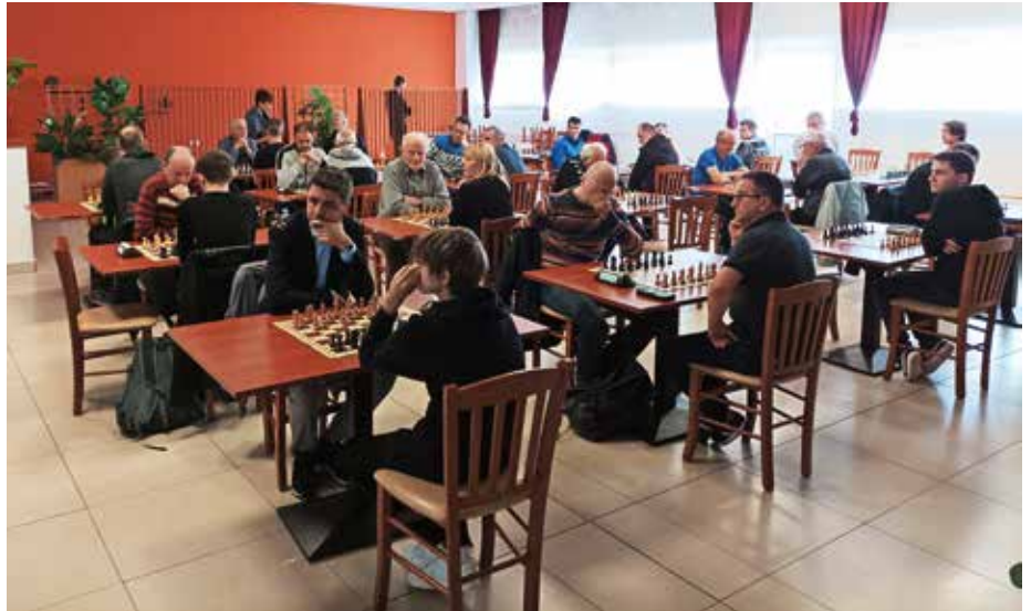
V Žireh je sredi maja potekal prvi letošnji šahovski turnir za pokal Poljanske doline.

Po triletnem zatišju zaradi covid-19 se vračajo turnirji serije PPD. Letos so predvideni štiri turnirji, prvi je bil odigran v Žireh drugo majsko soboto. Zbralo se je 33 šahistov, med njimi tudi ena šahistka.