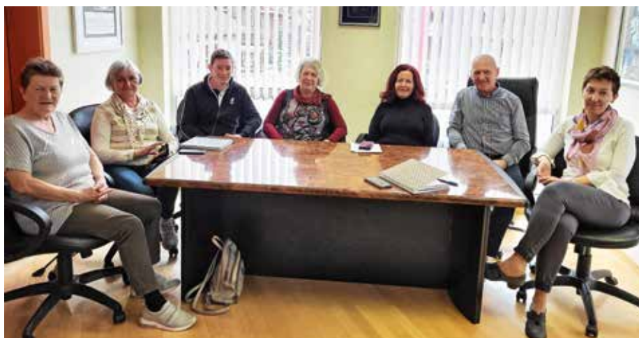
Voditeljice žirovskih skupin marca na obisku pri županu / Foto: arhiv Vide Pondelek

Drugo skupino, Podmladek, je osnovala Vilma Mazzini: »V letu 2019 sem naredila seminar za vodjo skupine Starejši za starejše. V začetku septembra istega leta smo se prvič zbrale in ustanovile sku-