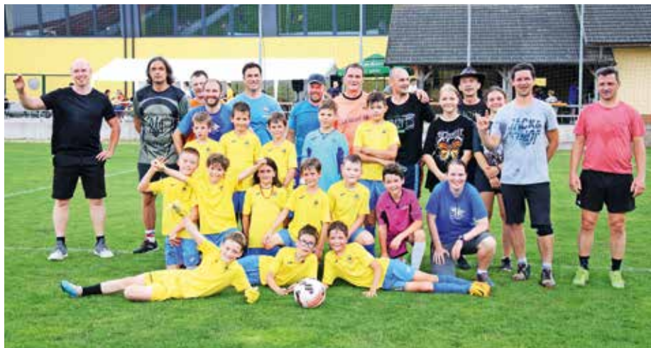
Ob praznovanju petdesetletnice so se na tekmah s starši in trenerji najprej predstavile mlajše selekcije.